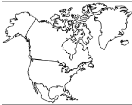
Amérique du nord +