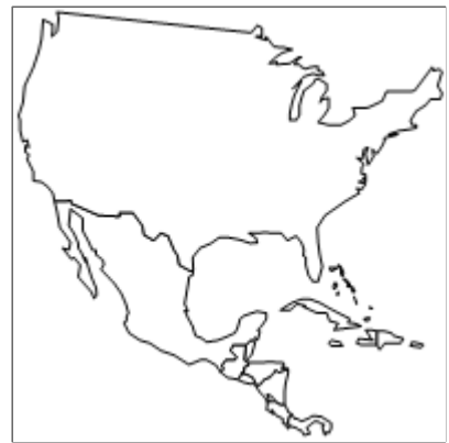
Amérique centrale +